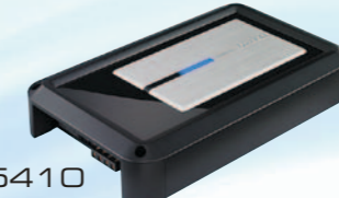
XH5410 مكبر طاقة صوتي سعة ٢/٢ قناة بقوة ٦٨٠ واط