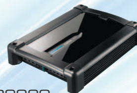
XR2220 مكبر طاقة صوتي سعة ٢/١ قناة بقوة ٢٨٠ واط