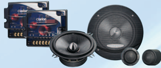
SRP1322S نظام بمكونات ثنائية الاتجاه بقوة ٣٠٠ واط كحد أقصى مقاس ١٣ سم (٤/١-٥ بوصة)