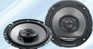
SRE1722R نظام متحد المحور ثنائي الاتجاه بقوة ٢٨٠ واط كحد أقصى مقاس ١٦,٥ سم (٦/١-٦ بوصة)