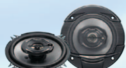
SRE1332R نظام متعدد المحاور ثلاثي الاتجاه بقوة ٣٥٠ واط كحد أقصى مقاس ١٣ سم (٤/١-٥ بوصة)