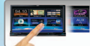
شاشة لمس سهلة الاستخدام تدعم التحريك للتمرير السهل من قائمة إلى أخرى