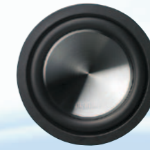
WQ2510D مضخم صوت قطره ٢٥ سم (١٠ بوصة) كحد أقصى مجهز بملف صوتي ذي مقاومة قدرها ٤ أوم بقوة ١٥٠٠ واط