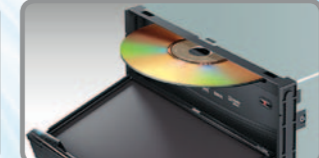
وحدة تحكم منزلقة آلية ومنفذ أقراص

محطة وسائط متعددة 2-DIN DVD مع تحكم بواسطة لوحة لمس بطول 7 بوصة و USB وتنقل داخلي