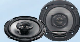
SRG1622R نظام متحد المحور ثنائي الاتجاه بقوة ٣٥٠ واط كحد أقصى مقاس ١٦ سم (٦/١-٦ بوصة)