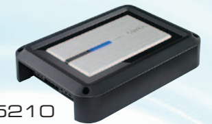
XH5210 مكبر طاقة صوتي سعة ٢/١ قناة بقوة ٣٤٠ واط