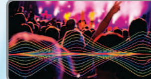
تشارك المزايا المتقدمة مثل Time Alignment، Beat EQ plus لضمان الصوت ذي الجودة العالية.