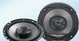
SRE1732R نظام متعدد المحاور ثلاثي الاتجاه بقوة ٣٠٠ واط كحد أقصى مقاس ١٦,٥ سم (٦/١-٦ بوصة)