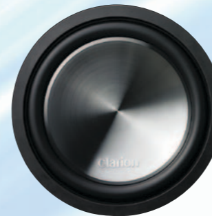
WG3010D مضخم صوت قطره ٢٠ سم (١٢ بوصة) كحد أقصى مجهز بملف صوتي ذي مقاومة قدرها ٤ أوم بقوة ١٥٠٠ واط