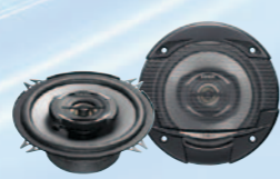
SRG1322R نظام متحد المحور ثنائي الاتجاه بقوة ٢٣٠ واط كحد أقصى مقاس ١٣ سم (٤/١-٥ بوصة)