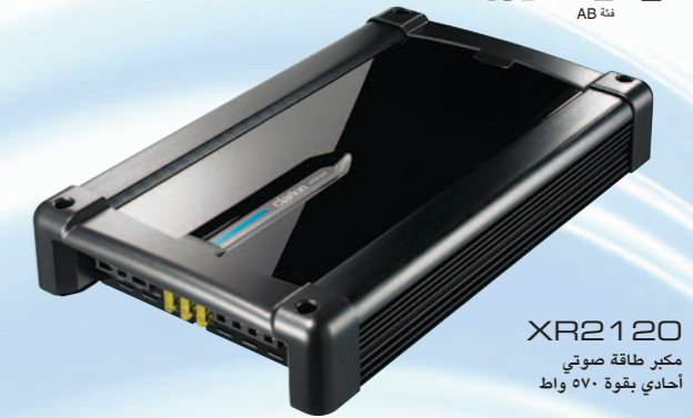
XR2120 مكبر طاقة صوتي أحادي بقوة ٥٧٠ واط