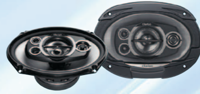
SRE6952R نظام متعدد المحاور خماسي الاتجاه بقوة ٦٠٠ واط كحد أقصى مقاس ١٥ سم (٦ بوصة × ٩ بوصة)