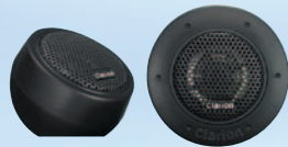
SRE212H مكبر صوت ذو محرك متوازن بقوة ٢٠٠ واط كحد أقصى مقاس ٢,٥ سم (١ بوصة)