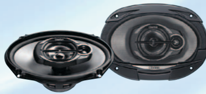
SRE6932R نظام متعدد المحاور ثلاثي الاتجاه بقوة ٤٠٠ واط كحد أقصى مقاس ١٥ سم (٦ بوصة × ٩ بوصة)