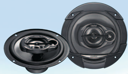
SRE2032R نظام متعدد المحاور ثلاثي الاتجاه بقوة ٤٠٠ واط كحد أقصى مقاس ٢٠ سم (٨ بوصة)