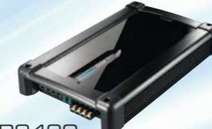
XR2420 مكبر طاقة صوتي سعة ٤/٢ قناة بقوة ٤٨٠ واط