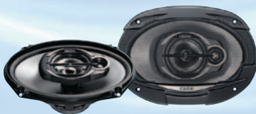
SRG6932R نظام متعدد المحاور ثلاثي الاتجاه بقوة ٤٠٠ واط كحد أقصى مقاس ١٥ سم (٦ بوصة × ٩ بوصة)