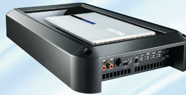
XH7110 مكبر طاقة صوتي أحادي قناة بقوة ٨٥٠ واط