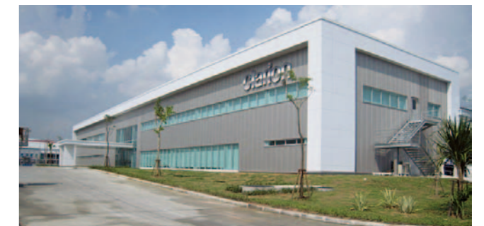
タイ工場は、自動車メーカー向けのカーオーディオ・カーナビゲーション・カメラの生産・販売を目的として2012年4月本格量産開始（初年度約60万台）。2016年には200万台／年規模の生産体制をめざします。

また、ワールドワイドな受注体制を整えるため、ASEAN地域の体制再編の一環として、タイに新工場を建設しました。タイ新工場は、自動車メーカー向けのカーオーディオ・カーナビゲーション・カメラの生産・販売を目的として、2012年4月に本格量産を開始し（初年度約60万台）、2016年には200万台／年規模の生産体制をめざします。これにより、部品調達から生産・納入までをタイムリーかつスムーズに行うようにすることで、世界中のお客様へ商品をお届けするための供給機能を強化します。