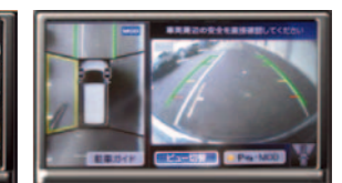
全周囲俯瞰映像表示例 (全周囲映像とリアカメラ映像)