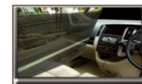
半透過映像表示例 (左側のドアを半透過表示)

当社の最新のOVMシステムは、ドライバーに対して自車(自分のクルマ)周辺の視界補助を提供するだけでなく、画像認識技術との組み合わせによってあらゆる方向からの障害物を検知し、ドライバーへ警報を発することが可能です。