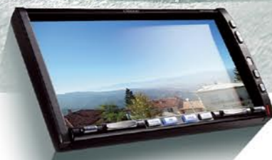
MAX973HD НАВИГАЦИЯ HDD И МУЛЬТИМЕДИЙНАЯ СТАНЦИЯ DVD С СЕНСОРНОЙ ПАНЕЛЬЮ УПРАВЛЕНИЯ