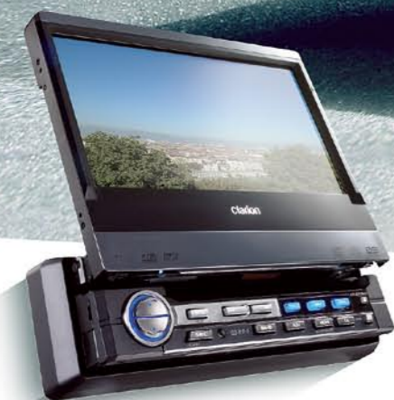
VRX878RVD МУЛЬТИМЕДИЙНАЯ СТАНЦИЯ DVD С УПРАВЛЕНИЕМ СоNET И 7-ДЮЙМОВОЙ СЕНСОРНОЙ ПАНЕЛЬЮ