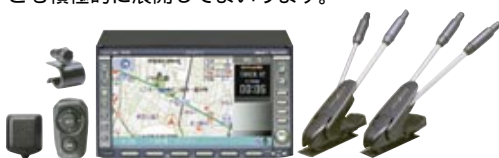
DVD カーナビゲーション MAX 420VD