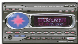
DSP内蔵CD/MD センターユニット： DMZ725LR(AM/FM, CD/MD 内蔵、CeNET対応)

近年、カーAVとカーナビゲーションを一体化した複合型DVDナビゲーションシステムの人気が高まっており、当社におきましても当該分野の商品をより一層充実させてまいります。一方、ITSの具現化、車載情報端末の進化に合わせて、市場拡大が予想される通信機能を有したカーナビゲーションシステムの開発にも経営資源を集中させております。クラリオンでは、国内外の主要自動車メーカーから相手先ブランドによる生産(OEM)としても高い納入シェアを獲得しており、今後とも積極的に展開してまいります。