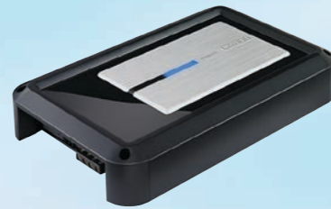
XH5410 Power amplifier 4/3/2-channel 680 W