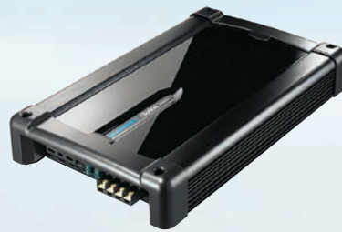
XR2420 Power amplifier 4/3/2-channel 480 W