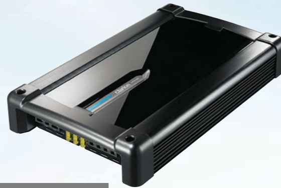
XR2120 Power amplifier 570 W mono