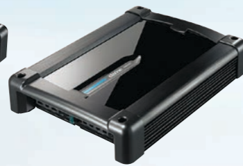
XR2220 Power amplifier 2/1-channel 280 W