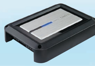
XH5210 Power amplifier 2/1-channel 340 W