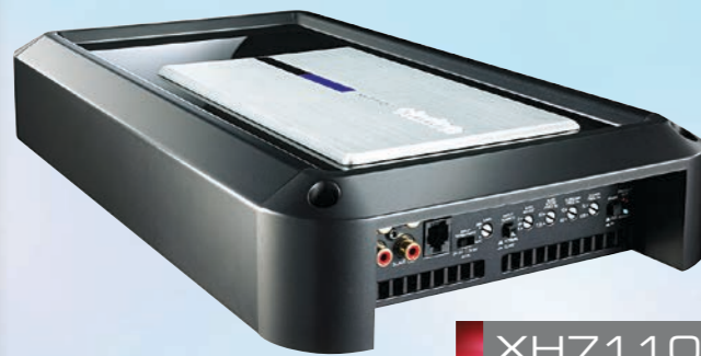
XH7110 Power amplifier kelas GH 850 W mono