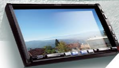
MAX973HD STATION MULTIMÉDIA, INTÉGRANT UN DISQUE DUR DE 30 GO UTILISÉ POUR LA NAVIGATION ET POUR LE STOCKAGE DE PLUS DE 4000 CHANSONS ET D'UNE INTERFACE IPOD AUDIO ET VIDEO INTÉGRÉE