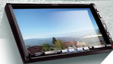
MAX973HD NAVEGACIÓN HDD Y ESTACIÓN MULTIMEDIA DVD CON PANTALLA DE CONTROL TÁCTIL