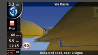
Geländedarstellung in 3D

Beim Fahren werden Hügel und Berge in 3D berechnet, um die Fahrumgebung der realen Welt besser abzubilden. 3D-Sehenswürdigkeiten werden im 3D-Modus nahtlos in die grafische Berechnung eingegliedert und blockieren den Blick auf POI und andere nützliche Informationen auf der Karte nicht.